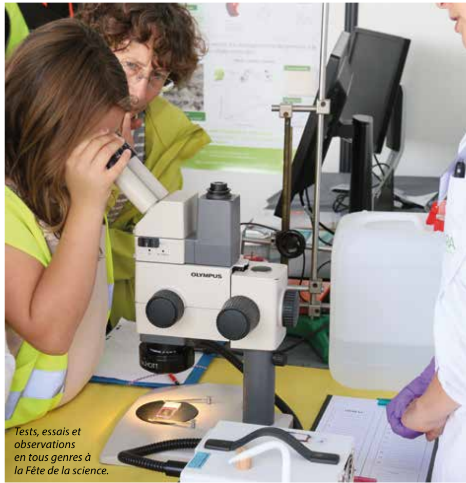
Tests, essais et observations en tous genres à la Fête de la science.

Comprendre les mécanismes de l'allergie, applaudir aux exploits d'un robot en action, s'initier au codage informatique... Voilà quelques-unes des 270 invitations lancées par la Fête de la science, organisée par l'État et la Région des Pays de la Loire jusqu'au 15 octobre.