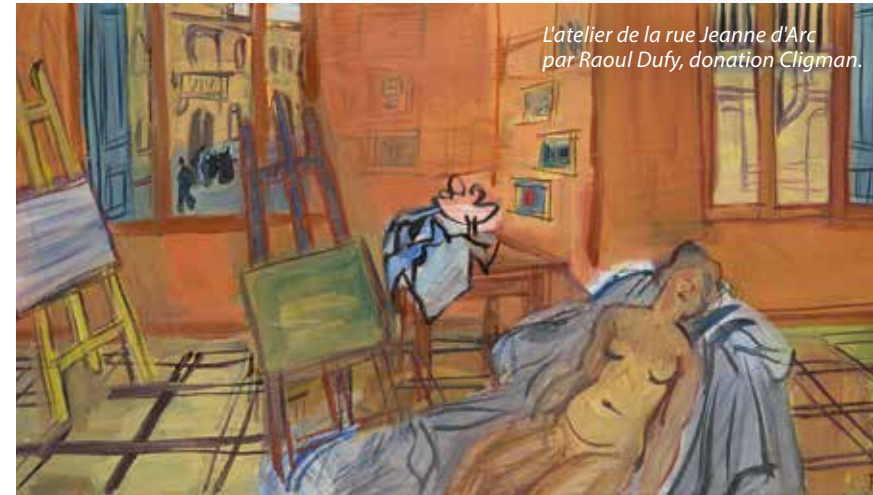
L'atelier de la rue Jeanne d'Arc par Raoul Dufy, donation Cligman.

C'est une nouvelle page qui s'écrit pour l'Abbaye Royale. D'ici à 2019, Fontevraud accueillera un musée d'art moderne qui abritera la donation de Martine et Léon Cligman.